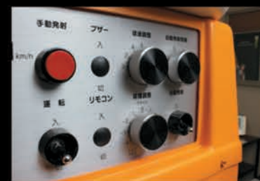
細かい調整に最適な専用ツマミを採用