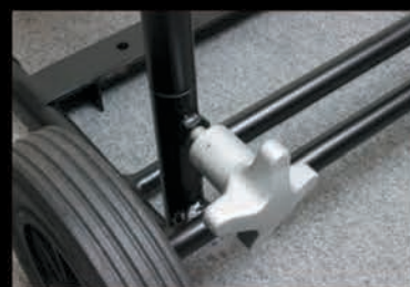
各部に耐久性のあるアルミノブを採用